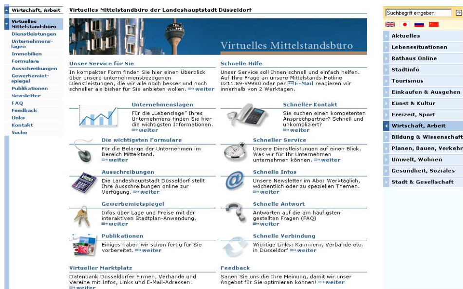
Abbildung 3: Düsseldorfer Unternehmensportal

Bei der Erhebung wurde ermittelt, dass ca. 63% der Düsseldorfer Unternehmen ein städtisches Unternehmensportal wünschen. Zur Erweiterung des städtischen Onlineangebotes für Unternehmen wurde daher im Rahmen des Projektes der Prototyp eines Unternehmensportals entwickelt (vgl. Abb. 3). Düsseldorf verfolgt mit dem Portal insbesondere die Zielsetzung, alle unternehmensrelevanten Angebote der Stadt „mit einem Klick“ über dieses Eingangsportale erreichen zu können; wie z.B. Bekanntmachungen über Ausschreibungen, Online-Formulare oder zentrale Ansprechpartner für unternehmensbezogene Dienstleistungen. Um eine bedarfsorientierte Unterstützung der Unternehmen zu gewährleisten, wird das Portalangebot gemeinsam mit der Wirtschaft weiter entwickelt.